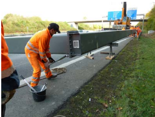
Stiel und Riegel werden in situ vormontiert.

Und genau das ist eine unserer Stärken: Fachkompetenz von der Beratung über die Planung bis hin zur Umsetzung.