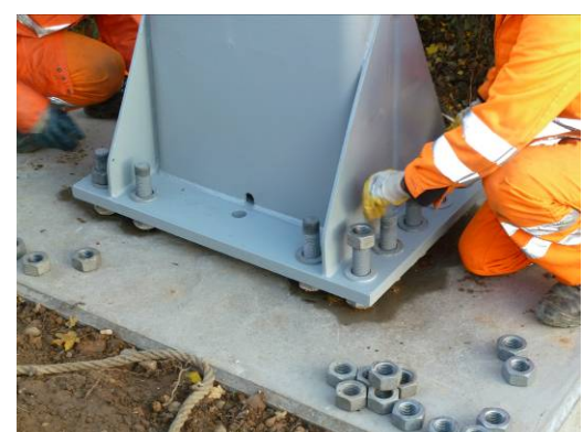
und verschraubt: passt!!!

Bei uns ist Ihre Baumaßnahme in einer Hand - mit der Erfahrung von vierzig Jahren.