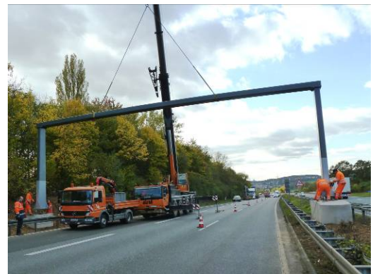
Die Verkehrszeichenbrücke wird positioniert.