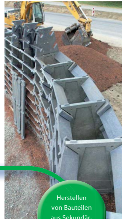
Herstellen von Bauteilen aus Sekundär-Kunststoffen