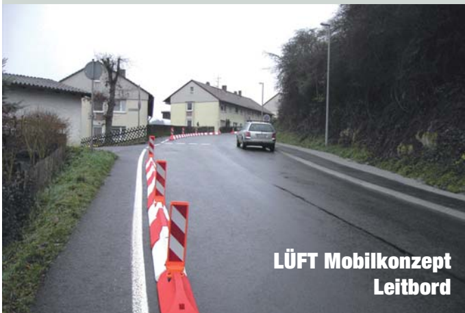
LÜFT Mobilkonzept Leitbord

Endlich Fußgängerschutz! Das 0,25 m hohe, robuste Leitbord , eingesetzt als seitliche Einengung in Bad Ems, Alte Kemmenauer Straße .