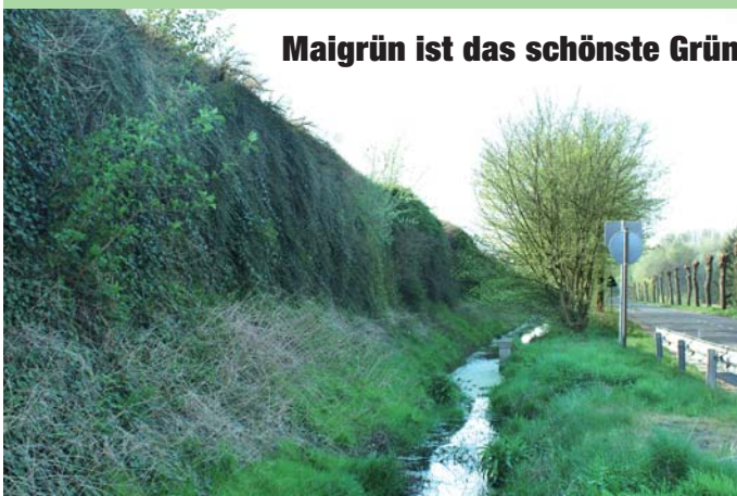
Maigrün ist das schönste Grün

Hinter diesem frischen Grün verbirgt sich die LÜFT Pflanzenwand „Modell Recycling“ und schützt ganz natürlich vor gesundheitsschädlichem Verkehrslärm.